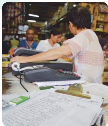
▲现代与传统混成一团,手忙脚乱成为最佳写照。