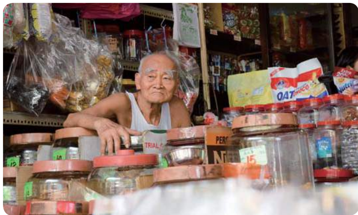
▲消费税的实行对传统老店家造成的冲击非常大。

目前政府也在努力的检举乱涨价的商家，以防止有人混水摸鱼，这样除了可以保障消费者的权益之外，也可以使到商家维持合理的价钱。