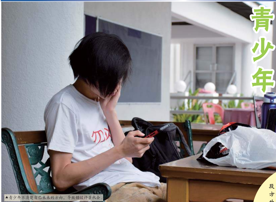
▲青少年不清楚自己未来的方向，导致错过许多机会

穹 蓝云浮，春意盎然，这一切都代表着希望。世间浮华，人总有难以选择的时刻，往往一瞬间的选择，所促成的可能是后半生的人生。然而对现今大部份的青少年而言，高中毕业往往不是人生希望的开始，相反的，是茫然不知方向，他们害怕为未来作出抉择。