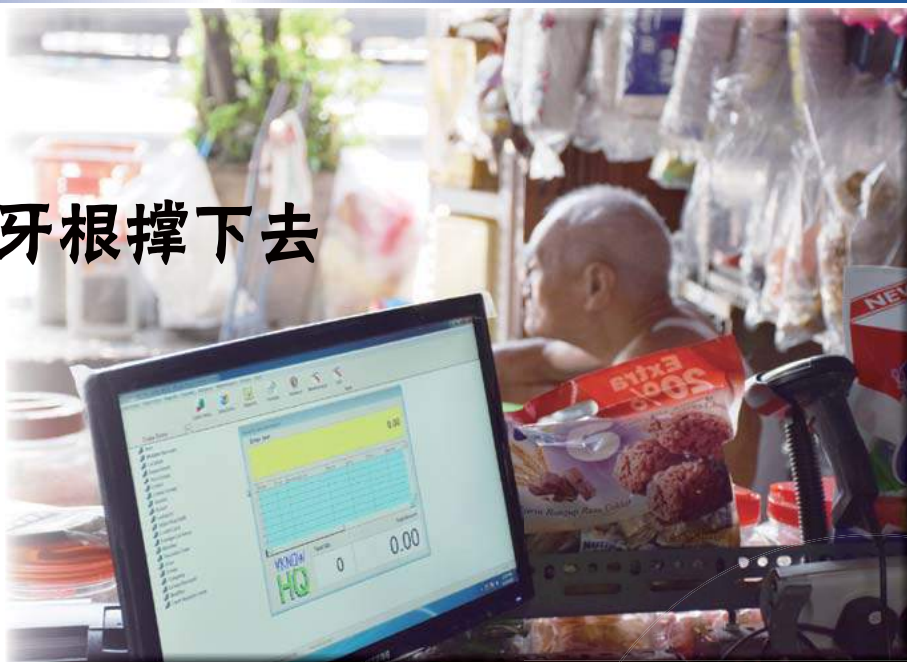
▲消费税来临,百年老店也必须电脑化,叫百岁老人如何是好?

传统老行业往往以薄利多销、贴心服务营运。因年轻人兴趣欠缺,都由老一辈独立撑起,沿用着传统的手记账方式管理整个店面。消费税的来临象征着现代科技系统的进驻,但却是传统老辈难以承受之痛。不少传统商店因此选择关闭,或手忙脚乱适应,或以不变应万变的姿态等待取缔。他们如何咬紧牙根撑下去?让《观察家》带你走一遭!