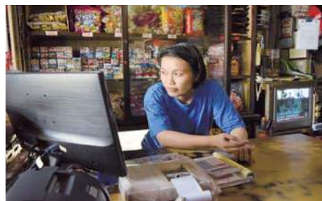
▲传统商店难以适应消费税。

时代的进步是需要的，只是在进步的同时我们也在无情的淘汰着，那些无法寻回的过往。正如一间受访老店所说的，这是一项考验，对老店的考验，考验着老店能不能够撑过这个时代，若不能够也只好谢幕。