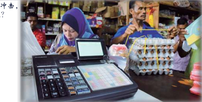
▲新式计算器取代了传统杂货店算盘，便于商家计算。

“我现在的做法是，在佳节或人潮多的时候，聘请兼职学生帮忙打印收据。”他无奈的说，电脑打印和聘请额外人力处理，都加重生意的成本。