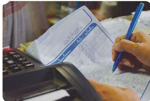
▲手写单据仍是传统老店少不了的记账方式。